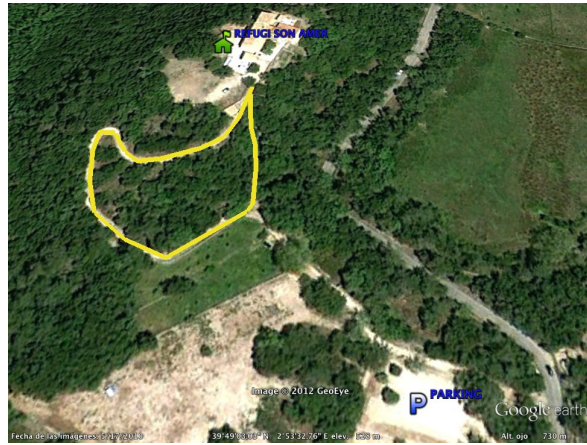
Circuit 2: 600m